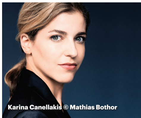
Karina Canellakis

De in New York geboren Karina Canellakis is sinds 1 september 2019 de nieuwe chef-dirigent van het Radio Filharmonisch Orkest, en zo de eerste vrouwelijke chef-dirigent van Nederland. Karina Canellakis studeerde af aan het Curtis Institute of Music in Philadelphia en de Juilliard School in New York. Ze maakte in maart 2018 een uitzonderlijk debuut met het Radio Filharmonisch Orkest in Utrecht en Amsterdam, met werken van Britten, Sjostakovitsj en Beethoven. Karina Canellakis is de winnaar van de Sir Georg Solti Conducting Award 2016. Ze maakte haar Europese dirigeerdebuut in 2015 met het Chamber Orchestra of Europe in Graz, ter vervanging van wijlen Nikolaus Harnoncourt en keerde terug om Concentus Musicus Wien te dirigeren in vier symfonieën van een Beethovencyclus. Naast chef-dirigent van het Radio Filharmonisch Orkest is ze vaste gastdirigent van het London Philharmonic Orchestra en vaste gastdirigent van het Rundfunk-Sinfonieorchester Berlin (RSB). Dit seizoen maakte ze haar debuut