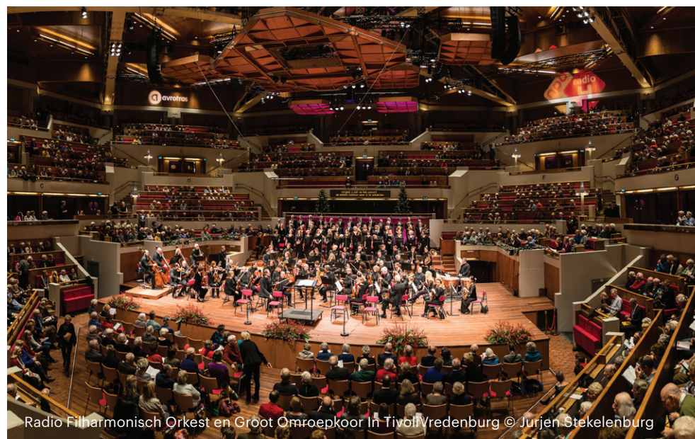
Radio Filharmonisch Orkest en Groot Omroepkoor in TivoliVredenburg