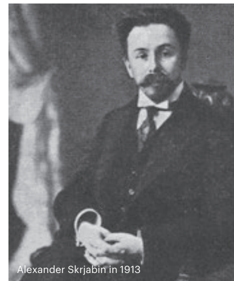
Alexander Skrjabin in 1913

valt op dat Skrjabin's eerste en enige concert juist in nostalgische bewondering aanknoopt bij de klankwereld van Chopin. Natuurlijk is de orkestpartij nóg rijker en klinkt de pianopartij nóg weelderiger, maar dit is slechts het gevolg van de expansieve ontwikkeling die de muziek in de negentiende eeuw doormaakt.