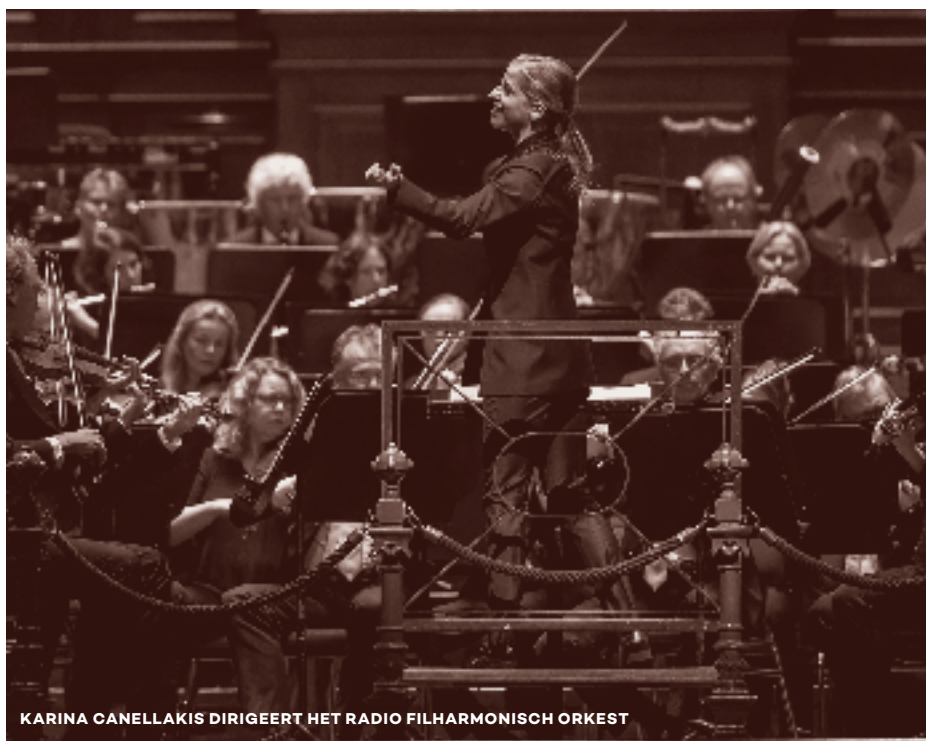
KARINA CANELLAKIS DIRIGEERT HET RADIO FILHARMONISCH ORKEST

◆ RADIOFILHARMONISCHORKEST.NL/ VRIENDEN-VAN-HET-RFO