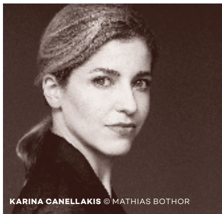
KARINA CANELLAKIS

De in New York geboren Karina Canellakis is sinds 1 september 2019 de nieuwe chef-dirigent van het Radio Filharmonisch Orkest. Ze maakte in maart 2018 een uitzonderlijk debuut met het Radio Filharmonisch Orkest in Utrecht en Amsterdam, met werken van Britten, Sjostakovitsj en Beethoven. Na afloop van deze concerten klonk bij veel musici de roep om haar als chef-dirigent uit te nodigen. Karina Canellakis is de winnaar van de Sir Georg Solti Conducting Award 2016. Ze maakte haar Europese dirigerdebuut in 2015 met het Chamber Orchestra of Europe in Graz, ter vervanging van wijlen Nikolaus Harnoncourt en keerde in juni terug om Concentus Musicus Wien te dirigeren in vier symfonieën van een Beethoven-cyclus.