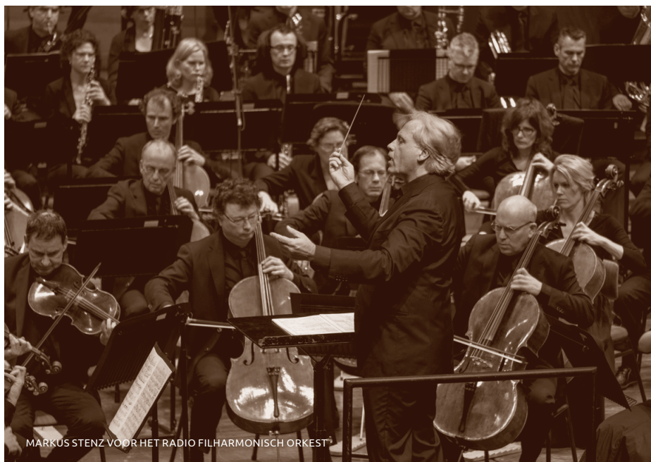
MARKUS STENZ VOOR HET RADIO FILHARMONISCH ORKEST

→ WWW.RADIOFILHARMONISCHORKEST.NL/VRIENDEN-VAN-HET-RFO