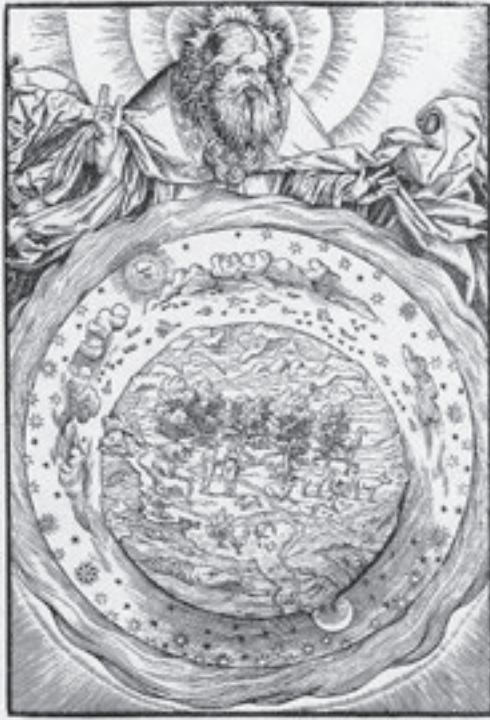
'DE SCHEPPING' (DUIITSE MEESTER, TWEDE HELFT ZESTIENDE EEUW)

een tweetal besloten uitvoeringen op 29 en 30 april 1798 was er al zo veel volk op de been dat men extra politie inzette om alles in goede banen te leiden. In maart 1799 vond onder overweldigende belangstelling – er werd om de plaatsen gevochten – de openbare première plaats. Een tijdgenoot die erbij aanwezig was noteerde: