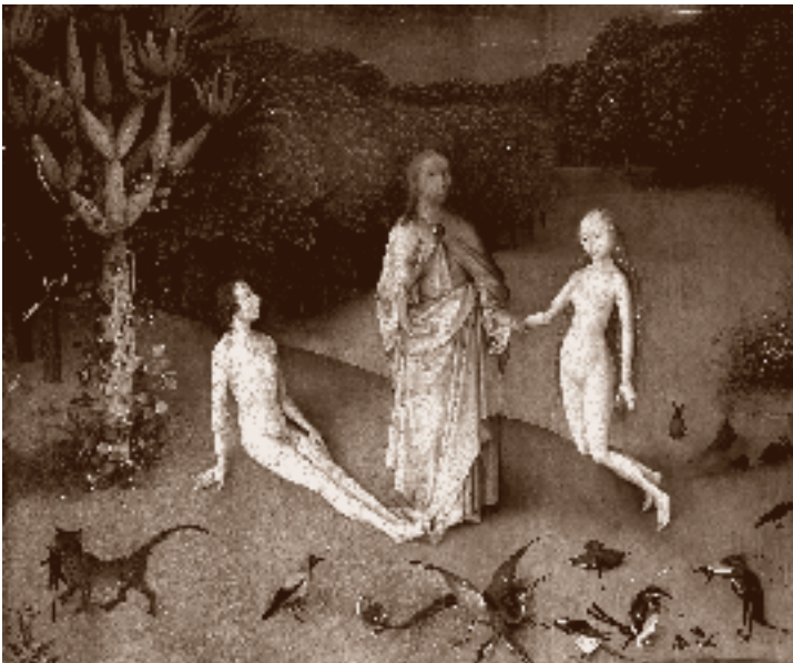
DETAIL UIT 'DE TUIN VAN AARDSE LUSTEN' VAN JHERONIMUS BOSCH (GEMAAKT IN 1503-1515)

Van Swieten was degene die ervoor zorgde dat de benodigde fondsen werden aangeboden om een uitvoering van het werk mogelijk te maken. Daarvoor benaderde hij twintig welgestelde mecenasen die ieder vijftig dukaten bijdroegen. En zo kreeg het werk zijn doop, onder auspiciën van het Gesellschaft der Associer-ten, met niet minder dan 120 instrumentalisten en 60 zangers. Bij