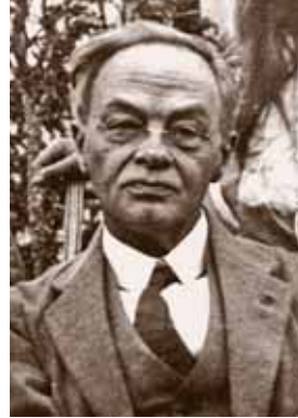
ALPHONS DIEPENBROCK PARIJS 1920

heroïque dirigeren bij het Concertgebouworkest. Omdat de partituur daarvan door de oorlog niet naar Nederland kon komen, maakte Diepenbrock zelf een orkestratie. Toen het bestuur van het orkest hoorde dat Debussy daarin de Brabançonne had verwerkt, deed het orkest moeilijk, uit angst de Duitsers tegen het hoofd te stoten. Diepenbrock ging overstag, echter pas nadat het orkest zich bereid had verklaard Wagners Kaisermarsch , waarin het Duitse volkslied is verwerkt, evenmin uit te voeren. Uiteindelijk vond de uitvoering van Diepenbrocks versie pas plaats op 14 november 1918, dus kort na de wapenstilstand. Diepenbrock dirigeerde het Concertgebouworkest in een programma met voor de pauze louter Franse stukken (onder meer van Debussy, die in maart 1918 was overleden, zodat het concert ook een in memoriam-karakter had) en na de pauze eigen composities. Naast kleine verschillen tussen Debussy en Diepenbrock in de bezetting en de orkestratie is er één groot: Diepenbrock houdt zich aan de noten van de pianoversie, Debussy voegde aan het slot een timide gespeelde herhaling toe van het begin van de Brabançonne . Ook in treurige composities bleef Debussy een fijnbesnaarde estheet.