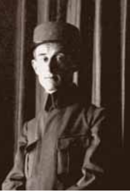
MAURICE RAVEL ALS SOLDAAT

La veille maakte was ik compleet verzvolgen door het element muziek, doch altijd daarna heb ik La veille nimmer kunnen horen zonder ten diepste geschokt, bijna vermorzeld te worden door de tekst.”