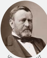
ULYSSES S. GRANT

14. Duet for one – Dit nummer was in 1976 het enige eclatante succes van de musical: het moest worden gebisseerd. (Julia Grant, Lucy Hayes en koor)