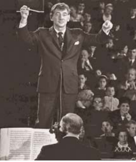
LEONARD BERNSTEIN DIRIGEERT HET NEW YORK PHILHARMONIC BIJ THE FIRST YOUNG PEOPLE'S CONCERT 1958

Toen 'Lenny' in 1958 (één jaar na het succes van West Side Story ) werd benoemd tot chef-dirigent van The New York Philharmonic schreef de heersende muzikale gedragscode voor dat deze positie onverenigbaar was met activiteiten op Broadway. In de elf 'filharmonische' jaren heeft Bernstein keihard gewerkt: concerten, televisieoptredens, plaatopnames en netwerken. Het orkest voer er wel bij, maar van componeren kwam weinig terecht. Het afscheid van de Philharmonic werd dan ook ingegeven door de wens om meer componeertijd te hebben. Maar het kan weinigen ontgaan zijn dat er intussen een innige relatie met de Wiener Philharmoniker groeiende was, dus alweer een excuus om maar niet aan die ultimate American Symphony toe te komen.