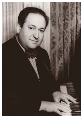
ERICH WOLFGANG KORNGOLD

Als filmcomponist won Korngold twee Academy Awards, waarvan één voor de muziek bij een Robin Hood-film die hij aanvankelijk weigerde te schrijven: “Ik componeer te veel met mijn hart om mee te werken aan een film die voor negentig procent uit actie bestaat”, zei hij daarover.