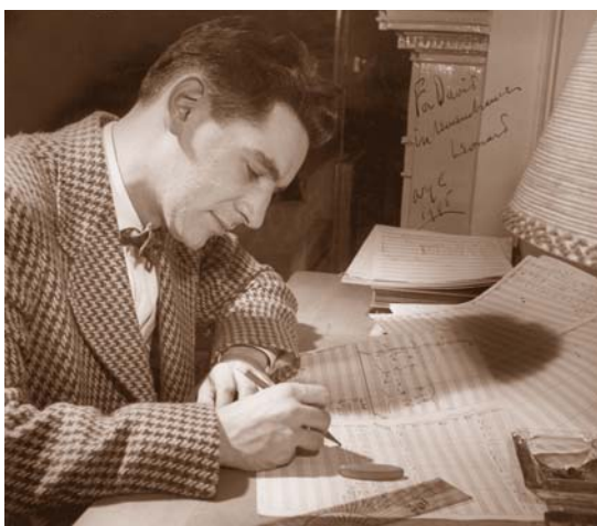
LEONARD BERNSTEIN IN 1945