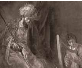
SAUL EN DAVID DOOR REMBRANDT