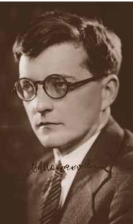
DMITRI SJOSTAKOVITSJ IN DE JAREN 30