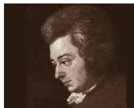
WOLFGANG AMADEUS MOZART DOOR JOSEPH LANGE, 1790

De Sovjet-componist Veniamin Basner maakte nooit een geheim van zijn diepe bewondering voor Dmitri Sjostakovitsj. Zelfs niet toen hij na de try-out van zijn Eerste symfonie door de muziekcommissie van de Sovjet-componistenbond misprijzend 'een kleine Sjostakovitsj' werd genoemd. De symfonie kreeg geen groen licht en de 33-jarige Basner werd genoodzaakt om zijn brood met filmmuziek te verdienen. Precies zoals Sjostakovitsj zelf, die door de jaren heen zijn uitvlucht vaak genoeg in de film- en theaternmuziek moest zoeken. Dankzij de steun van de componist, die de binnenkomende opdrachten naar zijn vroegere leerling begon door te schuiven, kreeg Veniamin voet aan de grond bij filmstudio's. Hij groeide uit tot een van de meest populaire liedjes- en soundtrack-componisten in de Sovjet-filmmuziekgeschiedenis, met meer dan honderd films op zijn naam. Dat hij ook nog twee opera's, vocale- en kamer-muziek, het celloconcert Koning David en de Symfonie Katerina Ismailova op zijn oeuvrelijstje had staan, kwam veel minder in de publiciteit. Vandaag de dag wacht Basners 'serieuze' muziek nog steeds op de aandacht van de klassieke muziekliefhebbers.